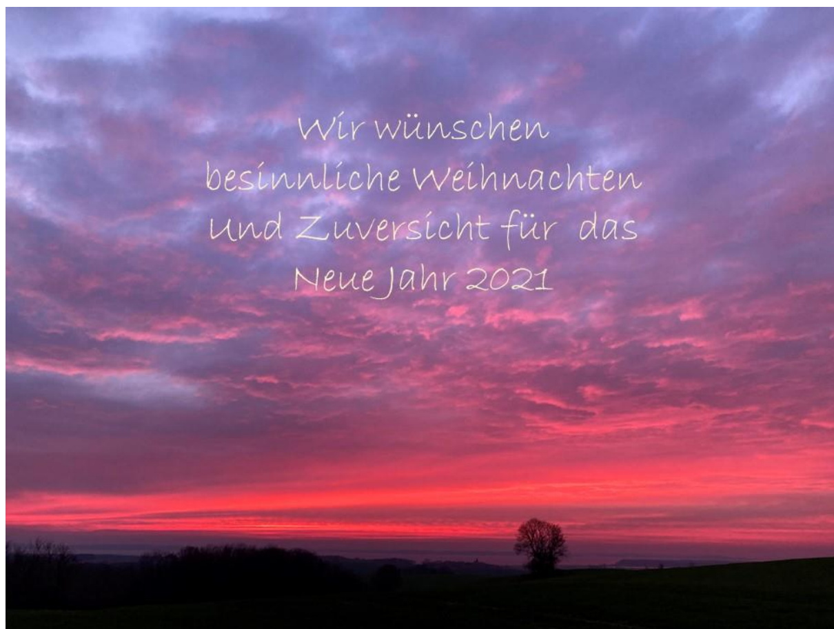
Abendhimmel über dem Großen Jasmunder Bodden, 5. Dezember 2020

Nach der dunklen Jahreszeit wird es wieder licht werden, und nach dem winterlichen „Lockdown“ der Natur wird sie im Frühling wiedererwachen. Dies sollte uns Zuversicht geben.